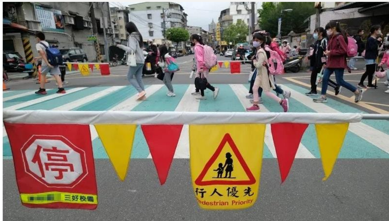
學校是最多兒童出入的地方，但台灣多數學區交通缺乏整體規劃。圖僅示意。

台灣真的是兒童行人地獄嗎？學校旁沒有人行 況。在環境尚未改善的情況下，親子又該怎麼