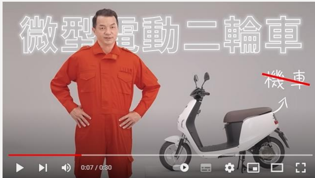
微型電動二輪車騎乘安全-安全不青菜篇 (國語版)

3、微型電動二輪車 (原：電動自行車)在去年 4 月草案修正通過，新制 11.30 正式上路，年滿 14 歲可騎乘，需登記、領用、懸掛牌照及投保強制汽車責任保險。有「類機車」屬性，因現行法規不須考照，相對衍生不少交通安全問題，教師可參考本模組適度提醒正確的騎乘觀念。