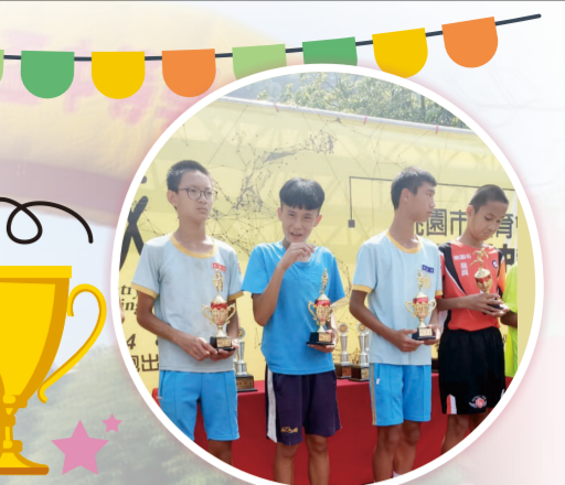
108桃園市理事長盃中等學校越野賽國男組個人第三名