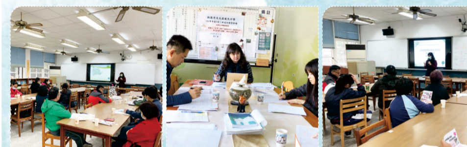
神龍擺尾-肢體障礙體驗活動 盲眼畫家-視覺障礙體驗活動

校長、主任及輔導老師與各班導師逐一針對班上每位同學分析其最佳升學管道，提供學生參考