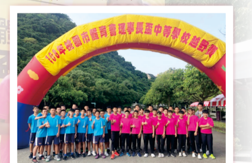
108年桃園市理事長盃中等學校越野賽 國男團體第二名 國女團體第四名