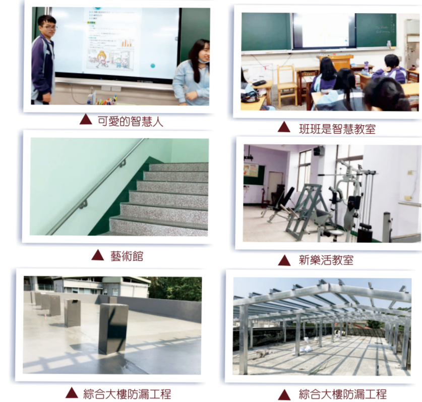
可愛的智慧人 班班是智慧教室 藝術館 新樂活教室 綜合大樓防漏工程

本校持續優化教學環境，提高學習效率。除108年11月落成啓用的運動場外，藝術館防水防漏工程、班班智慧教室也於日前完工。5月底，幼兒園整建工程、綜合大樓防水防漏工程將陸續完工。