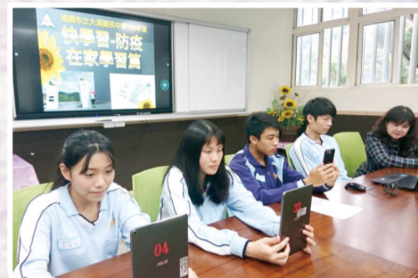
教育局 高安邦局長 與本校學生進行線上教與學(109.3.19)