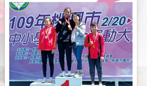
109桃園市中小學校聯合運動大會 國女組200公尺 第三名