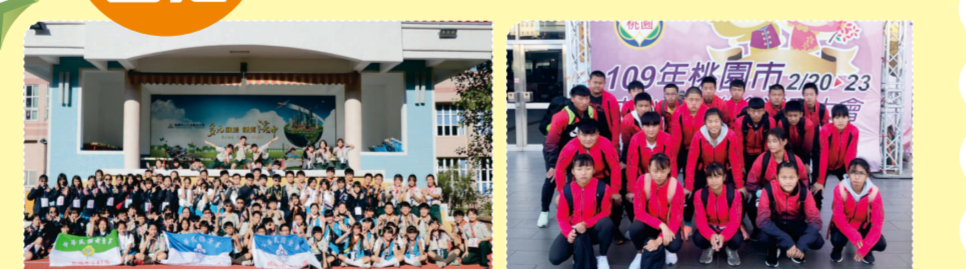
指痕處理 檢查並補充五油三水

在這裡，我看到學生們的樣態是很粗糙(或許還有點隨便)，但這不就是學習的雛型—生澀、單純、不斷探索的模樣？學習不限於教室，但「適性」讓我們終於體驗到—學習是快樂的。能合作、願意課後收拾殘局再離開，是我看過最美的學習風景。