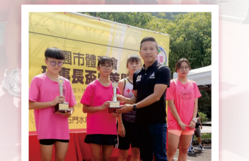
108桃園市理事長盃中等學校越野賽 國女組個人第一名