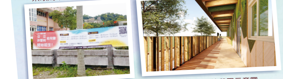
大溪非營利幼兒園招生登記 大溪非營利幼兒園示意圖

大溪非營利幼兒園設於本校，將於5月底整建完工，預計於109年9月1日招生，4/24、4/25、5/1、5/2接受登記。請至本校警衛室索取簡章。