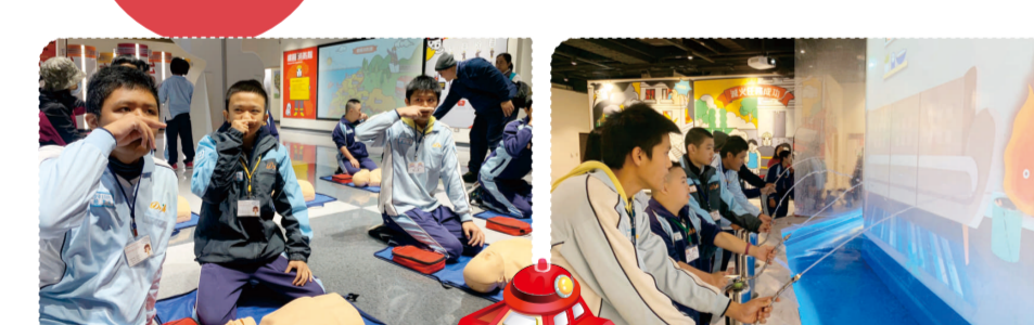
12年國教適性入學宣導 (109.3.14) 技藝專班家長說明會 (109.3.14)

校長、主任及輔導老師與各班導師逐一針對班上每位同學分析其最佳升學管道，提供學生參考