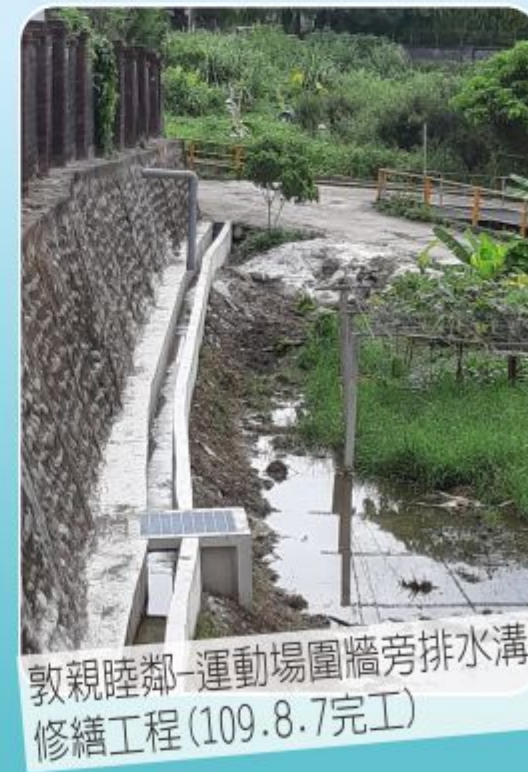
敦親睦鄰-運動場圍牆旁排水溝修繕工程 (109.8.7完工)