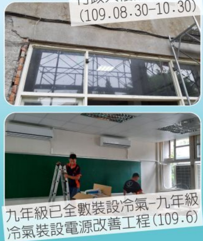
九年級已全數裝設冷氣-九年級冷氣裝設電源改善工程 (109.6)