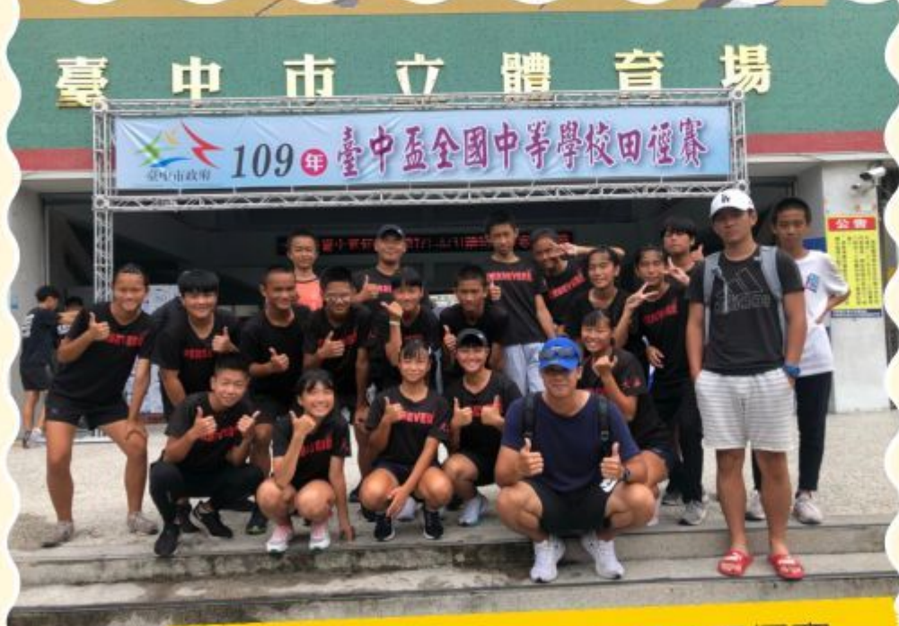
109年台中盃全國中等學校田徑賽