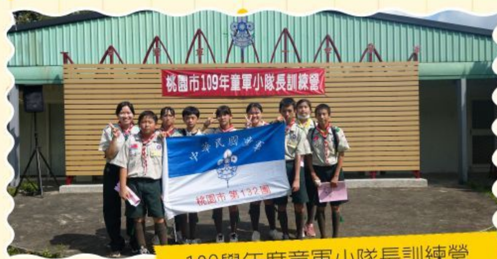
109學年度童軍小隊長訓練營