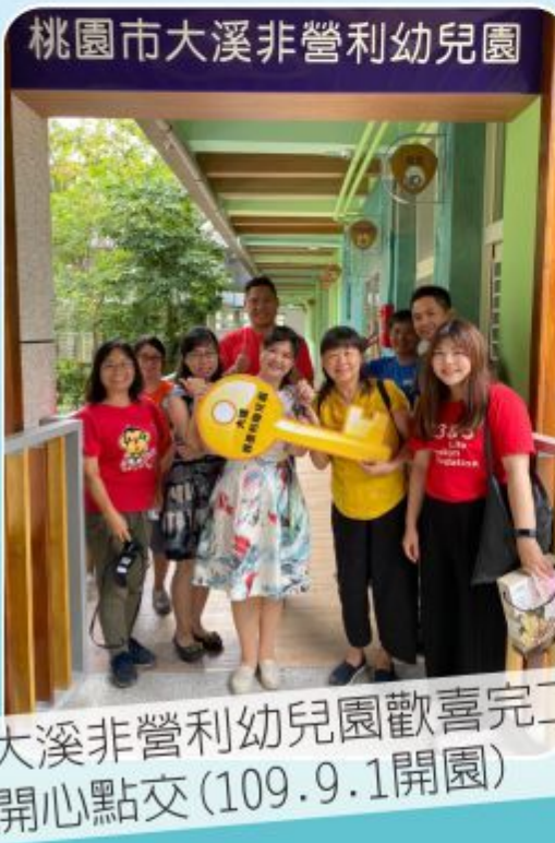
大溪非營利幼兒園歡喜完工 開心點交 (109.9.1開園)