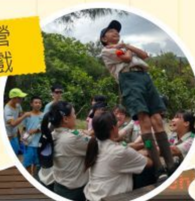
109全市大露營——采風活動