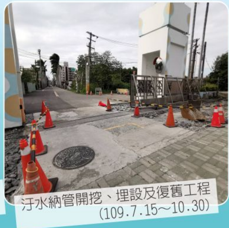
汙水納管開挖、埋設及復舊工程 (109.7.15~10.30)