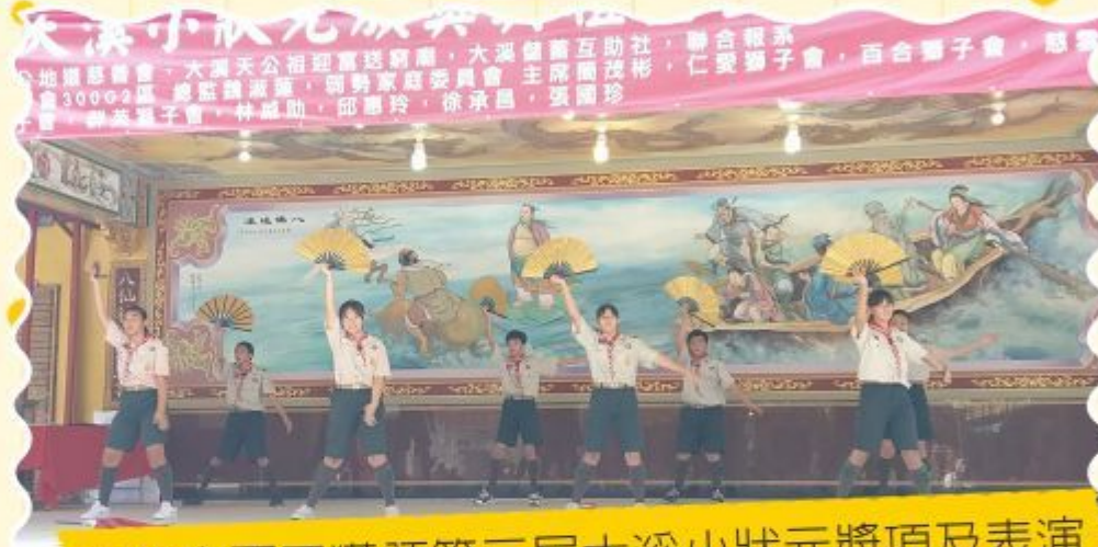
本校童軍團獲頒第三屆大溪小狀元獎項及表演