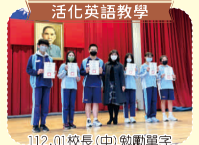
活化英語教學 112.01校長(中)勉勵單字認證優良班級