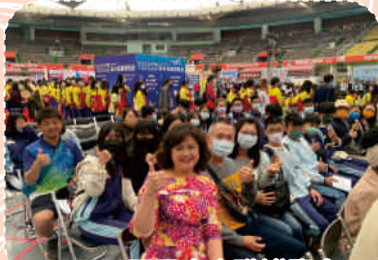
112.03巨蛋高中職博覽會校長與參加家長同學開心合影