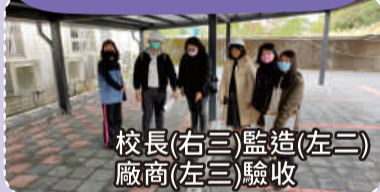
校長(右三)監造(左二)廠商(左三)驗收