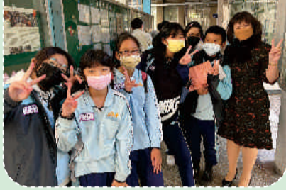
七年級夥伴與校長合影