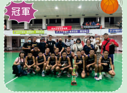
111全民運動楊梅盃籃球錦標賽