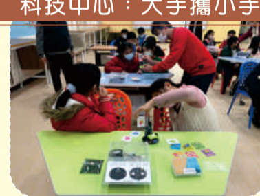
國小生體驗課程-登月小車