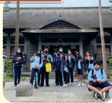
林佳均老師與同學踏查大溪老街