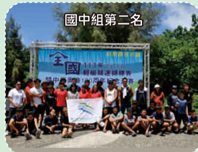
111.07全國輕艇競速錦標賽國中組第二名