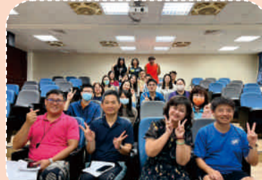
112.5校長與行政同仁開心合影