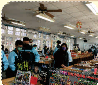
校長(中)親臨書展鼓勵學生開闊視野