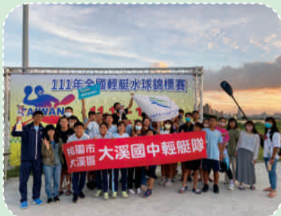
111年全國輕艇水球錦標賽-冠軍