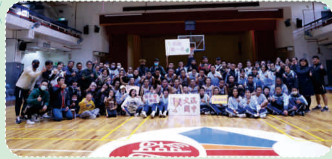
「111年桃園市國男乙籃球聯賽」榮獲全市冠軍