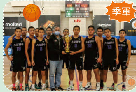
111.12全方位菁英盃籃球錦標賽季軍