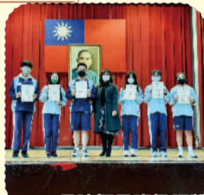
112.01晨讀優良班級頒獎