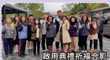
啟用典禮祈福合影