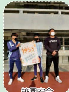
校園安全治霸凌教育宣導