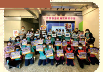
國小生體驗課程開心合影