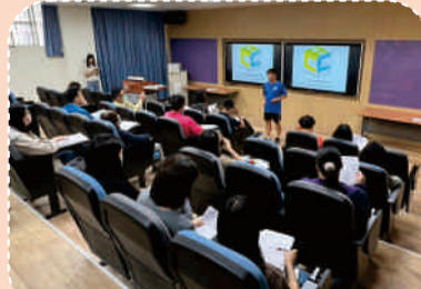
112.5輔導室宣導兒童權利公約