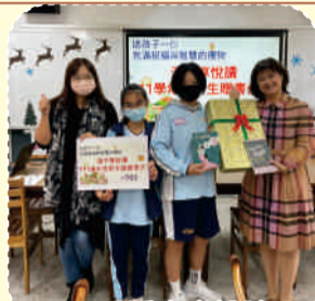
111.12溪中享悅讀-新生贈書儀式