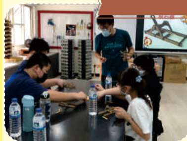
國小生參訪體驗課程-投石器