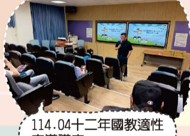
114.04十二年國教適性宣導講座