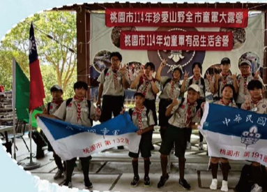
114.07桃園市全市大露營