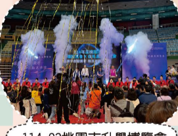
114.03桃園市升學博覽會