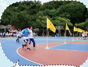
113.11校慶運動會趣味競賽