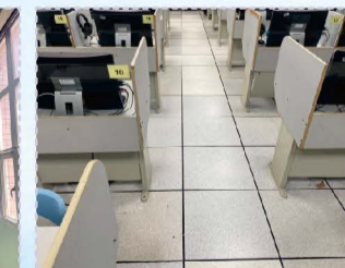
114.09語言教室地板部分更新