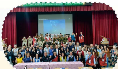
114.04大科崁事件公開觀議課全體嘉賓+705