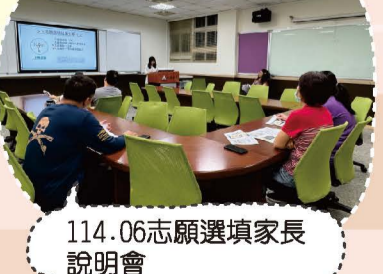
114.06志願選填家長說明會