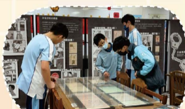
113 公民人權素養活動