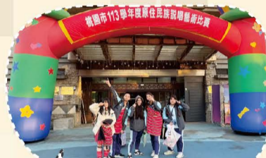
113.09原住民族語說唱藝術比賽