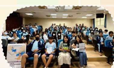
113 會考閱讀與思考策略講座