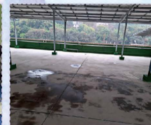
114.02活動中心頂樓防水