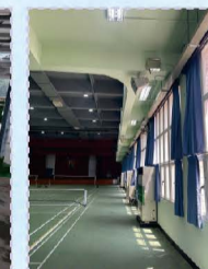
114.02活動中心牆壁粉刷