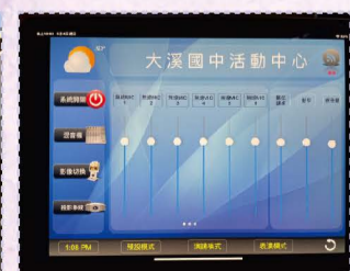
114.05活動中心音響更新