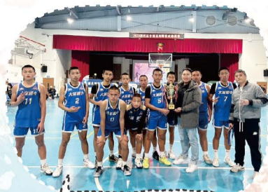
113.09第四屆青埔盃邀請賽亞軍