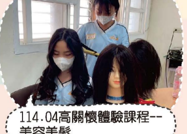
114.04高關懷體驗課程--美容美髮