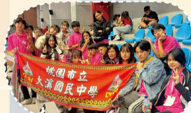
114.06原住民族語單詞全國賽