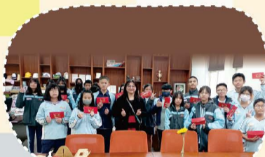
113.09 TVBS信望愛永續基金會頒獎