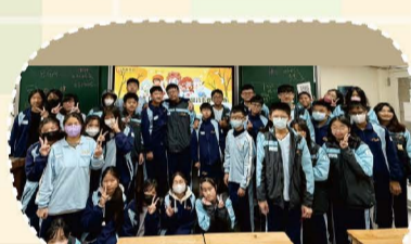
113 桃園PaGamO閱讀素養電競賽