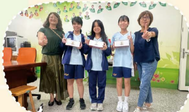
114.09桃園市語文競賽賽前勉勵