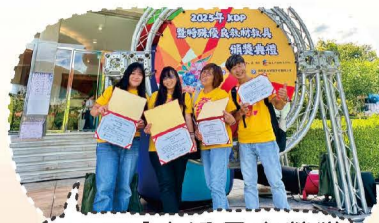
114.09【大溪國中榮獲全國學校經營與教學創新KDP國際認證獎-優等獎】