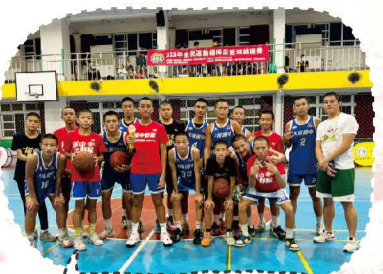
113.10全民運動楊梅盃邀請賽冠軍