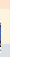
114.08科技教育營_木製卡祖笛