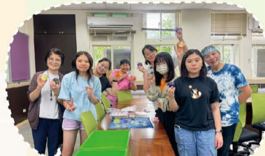
114.06原香教室手工皂製作