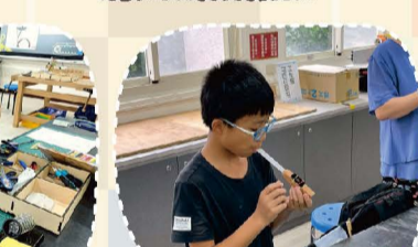
114.08科技教育營_小馬達機構玩具