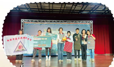
114.04第十屆原住民族語單詞競賽桃園市初賽亞軍