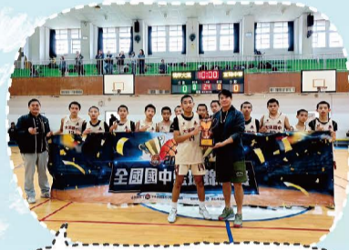
114.05全國國中U15籃球賽殿軍