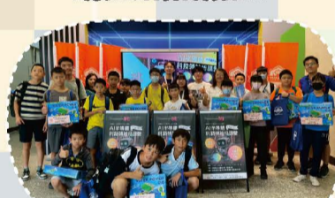
114.07 AI半導體科技領袖培訓營