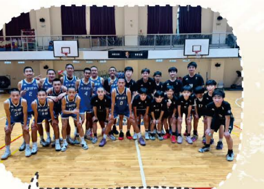
113.11日本U15俱樂部交流賽