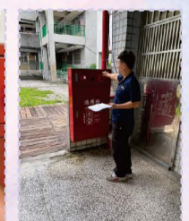
114.08避雷針系統保護裝置