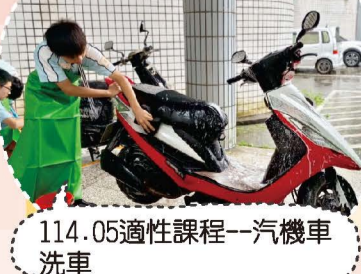
114.05適性課程--汽機車洗車