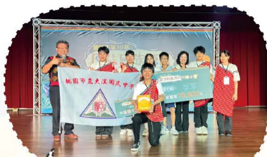
114.04第十屆原住民族語單詞競賽桃園市初賽季軍