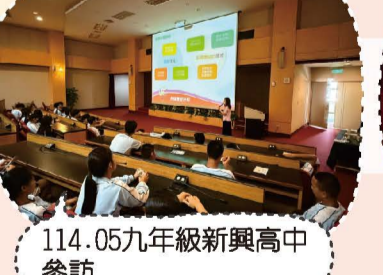
114.05九年級新興高中參訪