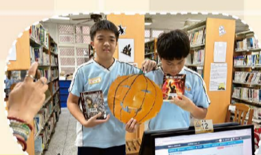
113 萬聖節圖書館快閃活動