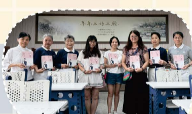
114 靜思書軒回流贈書參訪活動