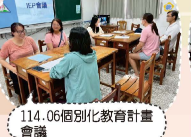
114.06個別化教育計畫會議