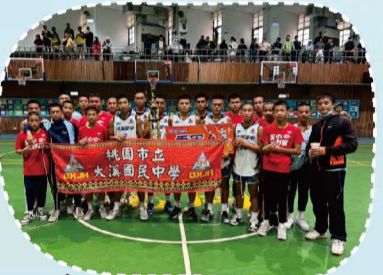
114.05桃園市市長盃季軍