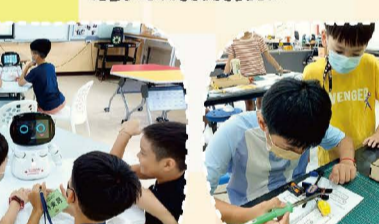
114.07科技教育營_凱比機器人