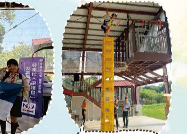
114.07桃園市全市大露營