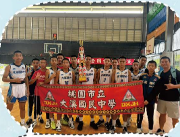
114.04全國中正盃籃球賽國男組亞軍