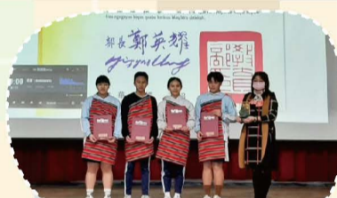
114.02全國語文競賽頒獎