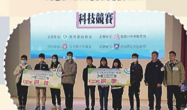
113.12桃園市113年度科技教育創意實作競賽-資訊科技組國中組銅牌獎